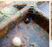
特定外来生物対策