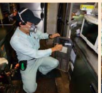
食品営業施設の 衛生害虫防除