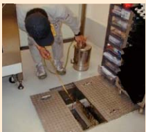
グリストラップの 衛生害虫防除