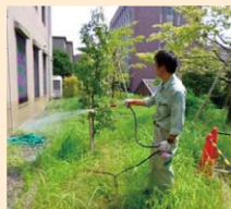
樹木の緑化害虫防除