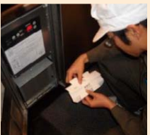
トラップによる調査